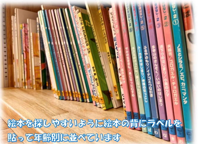
絵本を探しやすいように絵本の背にラベルを貼って年齢別に並べています