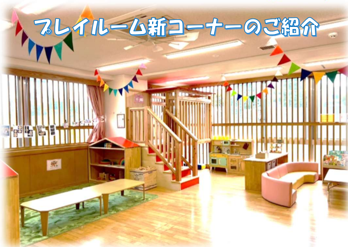
プレイルーム新コーナーのご紹介